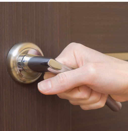
Poignée de porte en bec-de-cane

Une porte légère et facile à ouvrir peut grandement améliorer l'expérience client des personnes ayant des problèmes de motricité. Il existe des entreprises, qui se spécialisent dans l'installation de porte automatisée, qui peuvent vous guider dans vos choix.