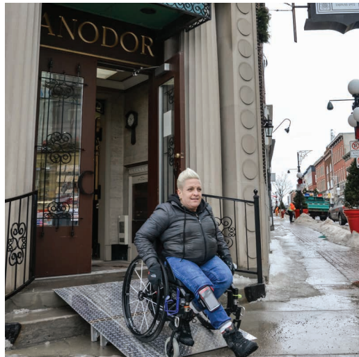
Rampe d'accès amovible

Avant d'entreprendre des travaux, vérifiez la réglementation auprès du Service de l'urbanisme de la Ville de Saint-Hyacinthe.