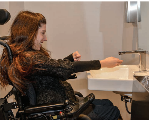
Lavabo avec un espace de dégagement

Pour les établissements de restauration, l'accessibilité des toilettes est un aspect important. Le diamètre de rotation à l'intérieur d'une des cabines doit être minimalement de 1,5 m. L'installation de barres d'appui et d'un interrupteur de lumière automatique sont des pratiques optimales.