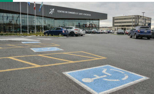
Espace de stationnement réservé