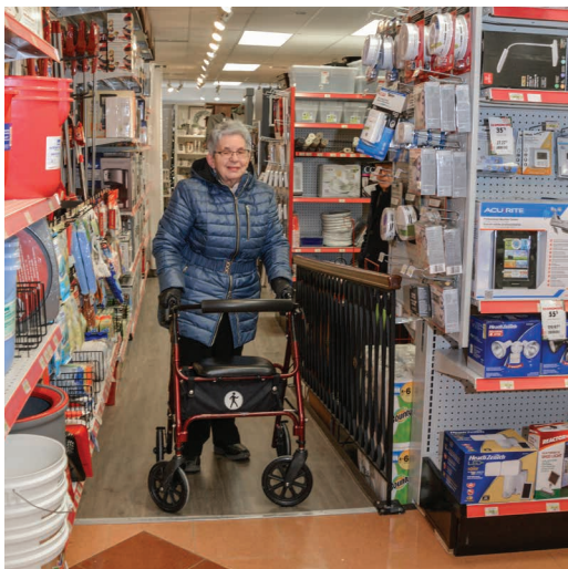
Allée permettant des déplacements sécuritaires