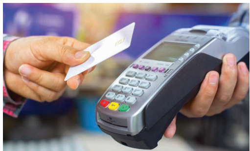
Terminal de paiement mobile