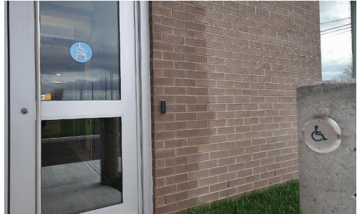
Porte avec bouton pressoir