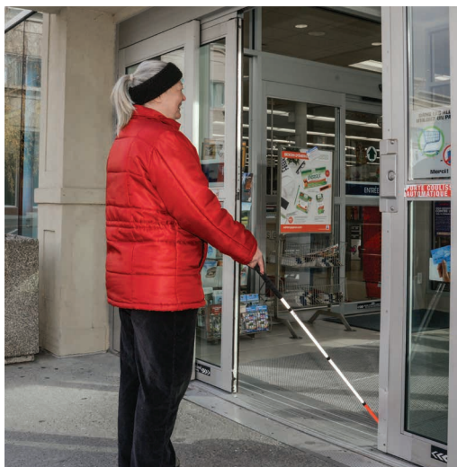
Porte d'entrée automatique